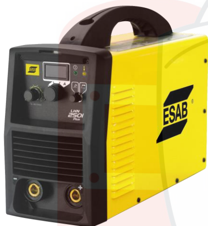
LHN 250i Plus

Конструкция аппарата LHN 250i Plus имеет высокую прочность, мощность, надежность и другие характеристики, которые облегчат вашу повседневную работу - например, цифровую панель индикации, длинные сварочные кабели и несколько ручек для переноса аппарата. И самый важный момент: большая мощность при сохранении компактности и малого веса. Модель LHN 250i Plus имеет большой рабочий цикл при 250 А с эффективностью до 60%, что дает вам возможность работать целый день.