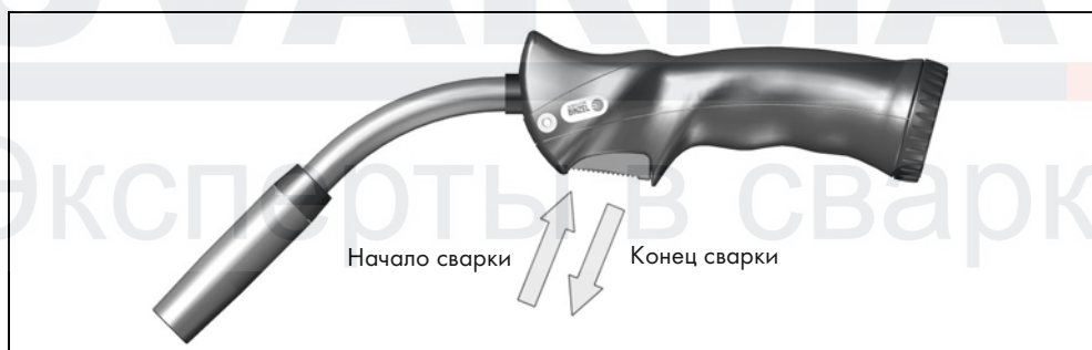
Рис. 3 Функции кнопки