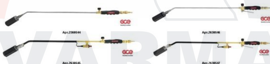
Характеристики KRASS GB – 211