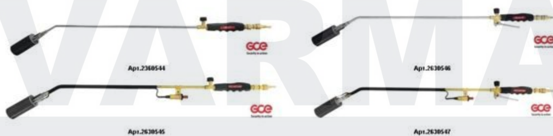
Характеристики KRASS GB – 211